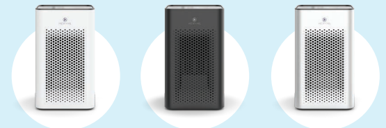
Available in white, black, and silver