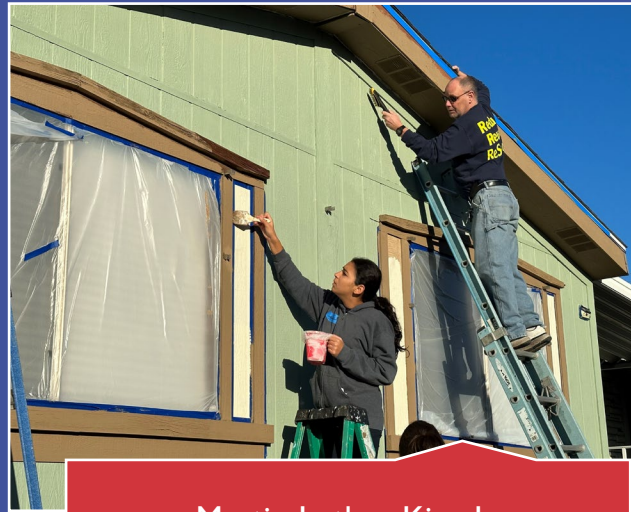
Martin Luther King Jr. San Bernardino