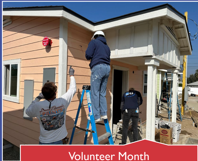
Volunteer Month Mes del Voluntariado Riverside