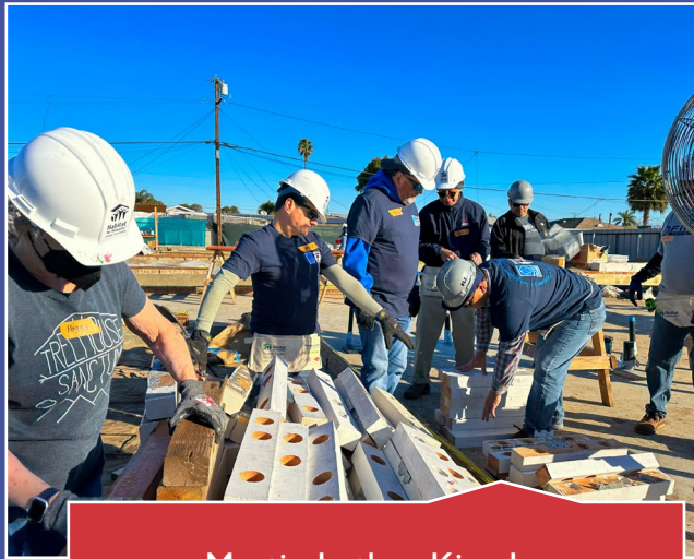
Martin Luther King Jr. Greater Los Angeles