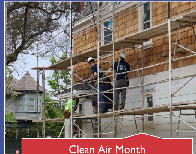
Clean Air Month Mes del aire limpio Orange County