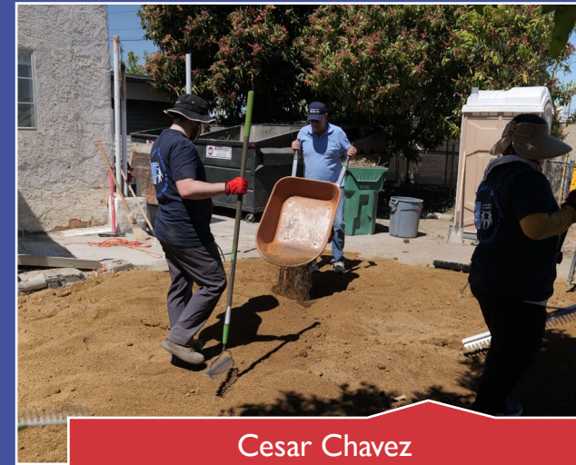
Cesar Chavez Coachella Valley Valle de Coachella